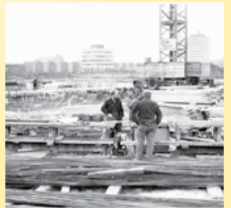
De Parrel in aanbouw.

Een complex geheel om te komen tot deze vorm van ontspanning sport en lichamelijke ontwikkeling. En over het zwembadcomplex gesproken kon ik mij niet direct herinneren in hoeverre in het uiteindelijke ontwerp er nog sprake was van een openluchtbad onderdeel. Een rondvraag in de Facebookgroep voor Selwerd leverde een flink aantal reacties op van de oudere inwoners die mij duidelijk maakten dat ze vooral veel zwemgenot hadden gehad in de eerste versie van zwembad de Parrel, maar dat daar zeker geen sprake is geweest van een buitenbad. Bij het college van burgermeester en wethouders vond men de begrote bedragen voor de bouw van het totale complex veel te hoog, waarna een streep door het buitengebeuren ging. De Parrel versie één bleef in gebruik tot augustus 1983 toen een felle brand een einde aan het complex maakte. Daarover een andere keer meer.