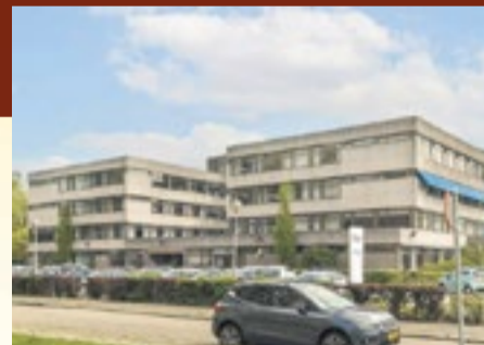
Blauwbörgje 2025

De plattegrond, die tijdens de bijeenkomst werd gepresenteerd, gaf onder meer aan dat het complex de vorm zou krijgen van een hoofdletter T. De staande balk werd daarbij gevormd door het eigenlijke verpleegtehuis, dat vijf bouwlagen zou gaan tellen. Twee zijvleugels vormden samen de dwarsbalk van de T. In de ene vleugel, bestaande uit twee lagen, was de keuken met daarboven een recreatiezaal voor driehonderd personen gepland. In de andere, drie lagen tellende vleugel, was op de begane grond de technische ruimte en daarboven waren