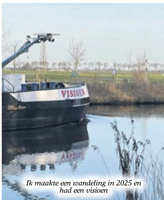
Ik maakte een wandeling in 2025 en had een visioen