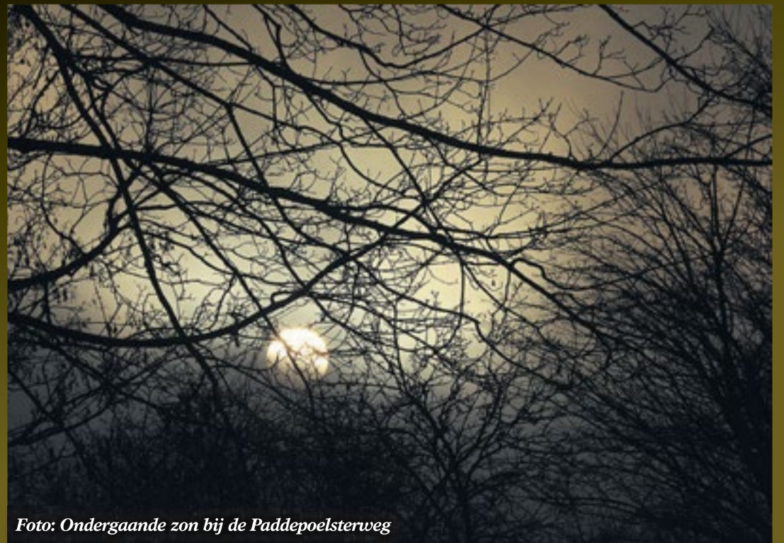
Foto: Ondergaande zon bij de Paddepoelsterweg

Tijdens deze donkere tijden van het jaar, waarbij de zon soms maar amper schijnt, is het voor de monnik soms ook even moeilijk zijn ritme te vinden. Hij liep zijn pad maar voorzigtig niet dat een deel ervan glibberig was. Met een smak kwam de monnik ten val. Gelukkig stond hij snel weer op om door te gaan. Hij had nog genoeg dingen op de rol staan die afgerond moesten worden. Eenmaal terug in zijn kloostercel voelde hij de pijn opkomen. In de kapel zat hij te bidden op de houten koorbank. Ondanks de scheut door zijn rug, genoot hij van de hemelse klanken die hij samen met de medebroeders vormde. De gewelven gaven een geweldige galm en voor hem ook kracht. Om zijn werkzaamheden te kunnen blijven uitoefenen, nam hij op advies van de abt van de abdij nu eerder rust.