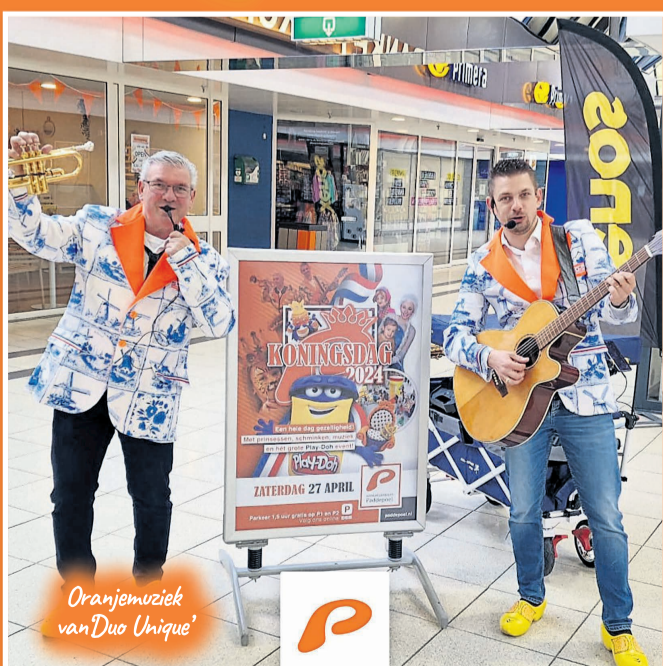
Oranjemuziek van Duo Unique