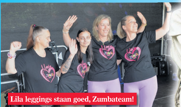
Lila leggings staan goed, Zumbateam!