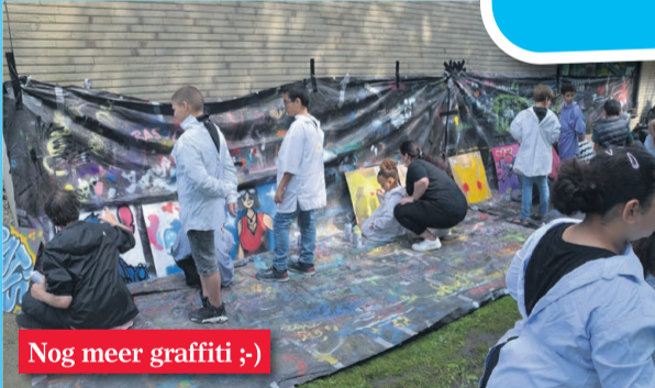
Nog meer graffiti ;-)

De redactie van de wijkkrant feliciteert het Wijkplatform en alle wijkbewoners van Selwerd met dit prachtige succesvolle feest. En nu... even de beentjes omhoog op de bank en dan maar weer op naar het 75-jarig bestaan!