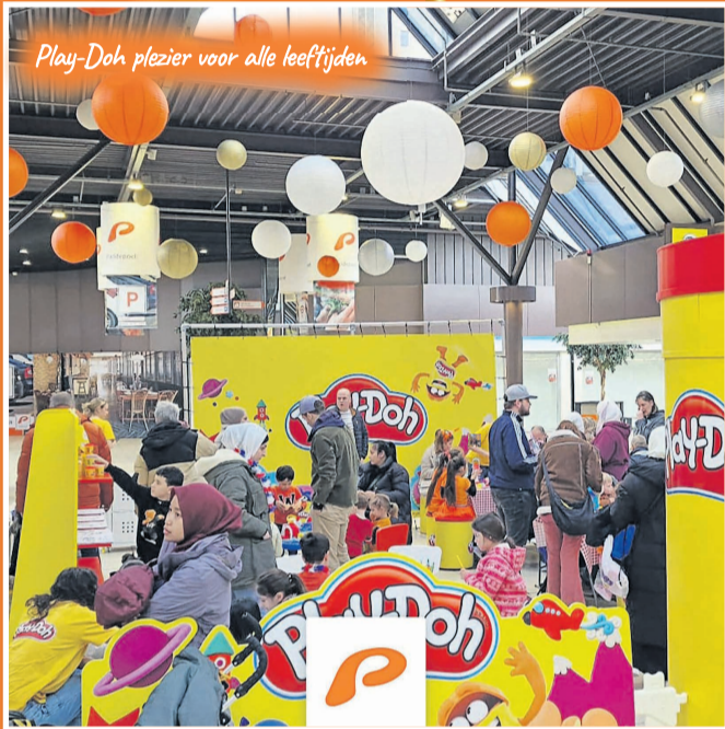
Play-Doh plezier voor alle leeftijden