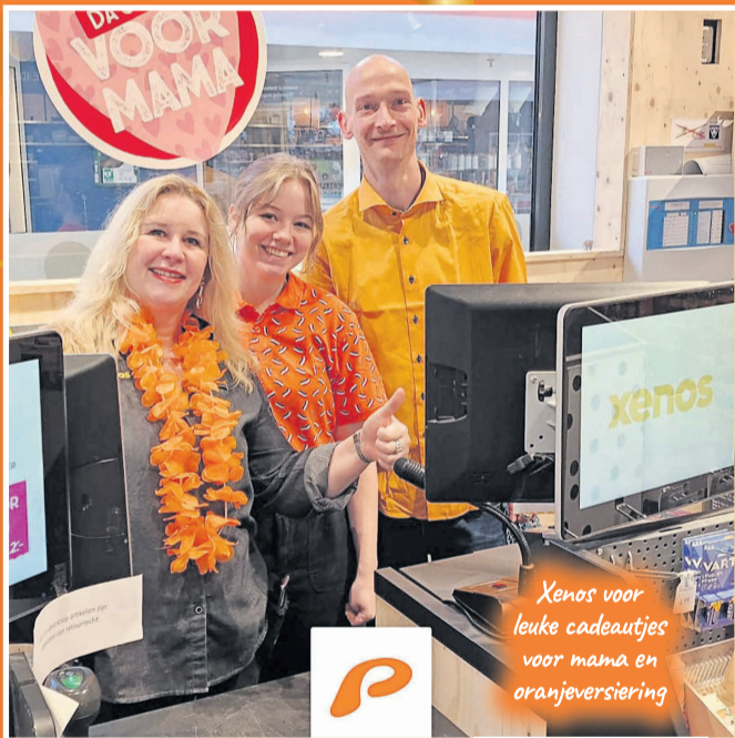
Xenos voor leuke cadeautjes voor mama en oranjeviering