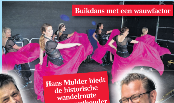
Buikdans met een wauwfactor