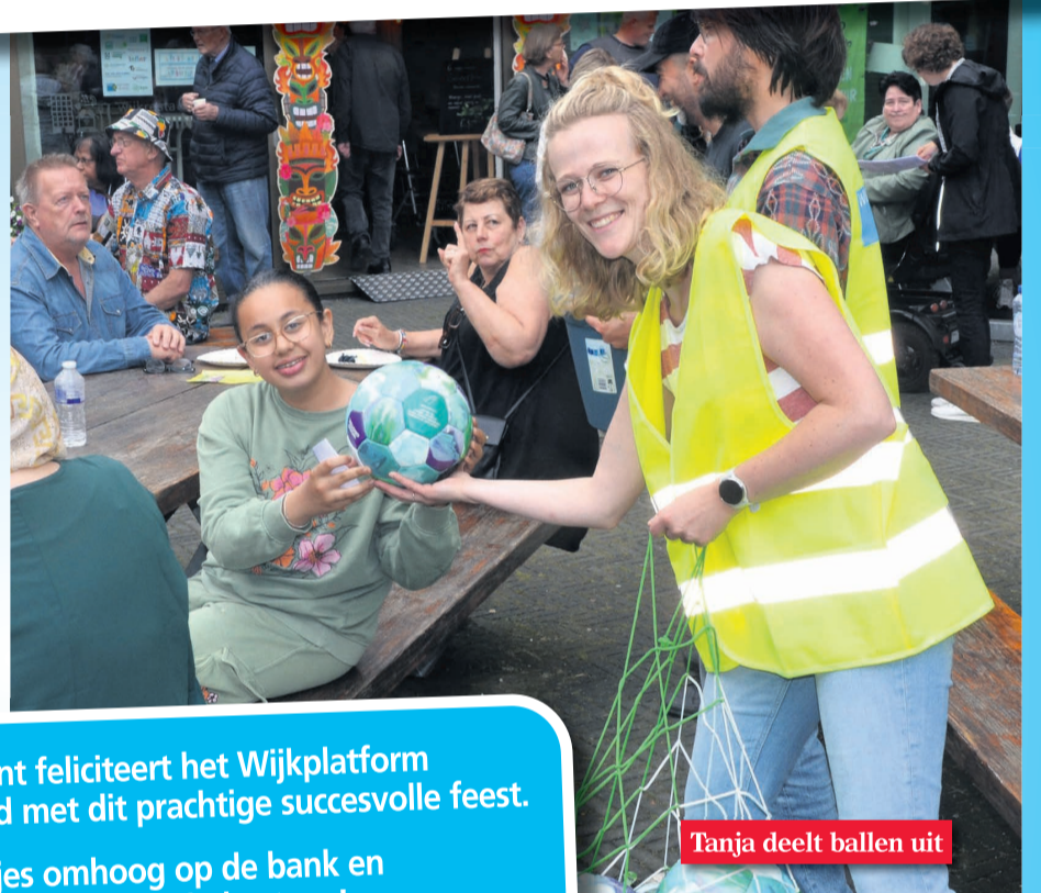
Tanja deelt ballen uit

De redactie van de wijkkrant feliciteert het Wijkplatform en alle wijkbewoners van Selwerd met dit prachtige succesvolle feest. En nu... even de beentjes omhoog op de bank en dan maar weer op naar het 75-jarig bestaan!