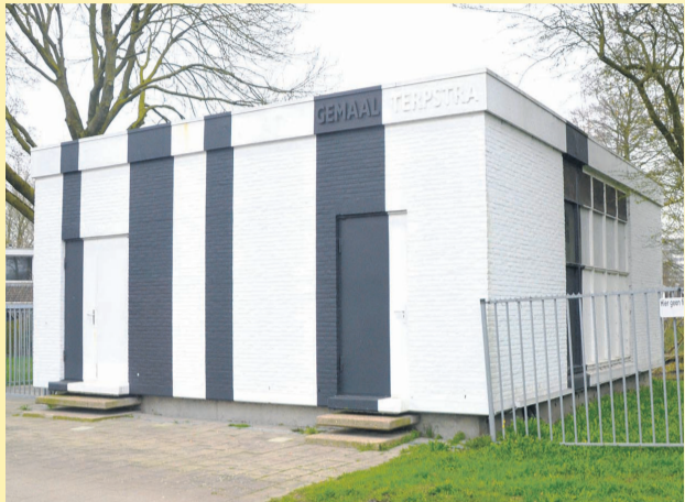
Het rioolgemaal aan de Kastanjelaan 1 in Selwerd.

We gaan deze keer terug naar het jaar 1971, toen onze wijken Selwerd en De Paddepoel nog volop in ontwikkeling waren. Het was natuurlijk een probleem om voor alle plannen, die uitgevoerd dienden te worden, genoeg financiën bijeen te krijgen. Een van de financiële bronnen was de provincie Groningen en de gemeente was afhankelijk van de besluitvorming van Gedeputeerde Staten.