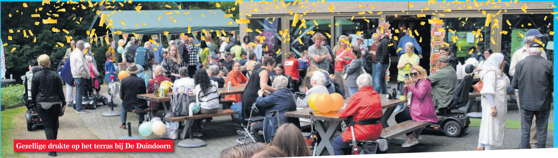
Gezellige drukte op het terras bij De Duindoorn