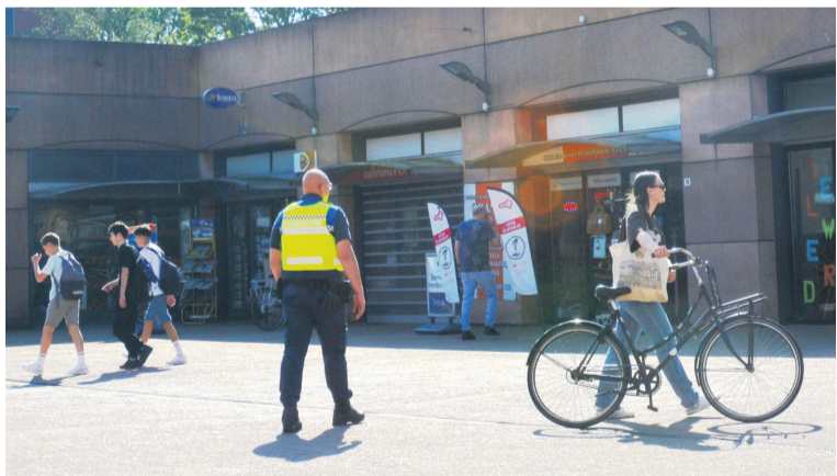
De BOA heeft onder andere als taak mensen die op het plein van winkelcentrum Selwerd fietsen te vertellen dat dit een voetgangersgebied is.