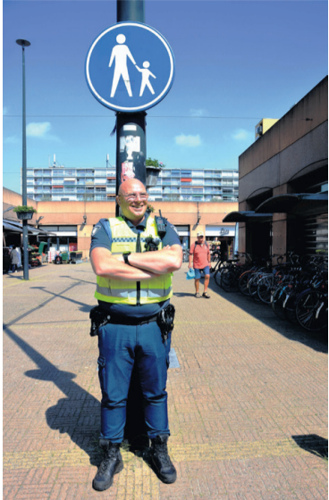
Dit bord betekent dus: bestemd voor voetgangers.

Fietsen is fijn! Je blijft langer gezond en zelfstandig. En je houdt contact met andere mensen. Doortrappen Groningen helpt je om fit en veilig te kunnen blijven fietsen. Meedoen? Geef je dan op voor de Doortrapdag op woensdag 3 juli 2024 vanuit Buurtcentrum Sonde2000, Eikenlaan 288-1, Groningen. 's Ochtends 9.30 uur is er aandacht voor veilig en behendig onderweg zijn met een elektrische fiets, fiets check en 's middags een fietstocht (20-25 km.) verzamelen om 13 uur. Tussen de middag wordt er een (gratis) lunch aangeboden voor diegene die de hele dag deelnemen. Heb je belangstelling? Opgeven kan voor 26 juni via de website: www.doortrappengroningen.nl