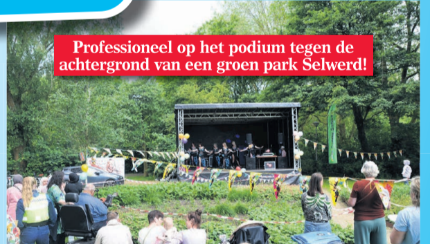
Professioneel op het podium tegen de achtergrond van een groen park Selwerd!