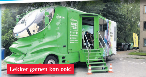
Lekker gamen kon ook!