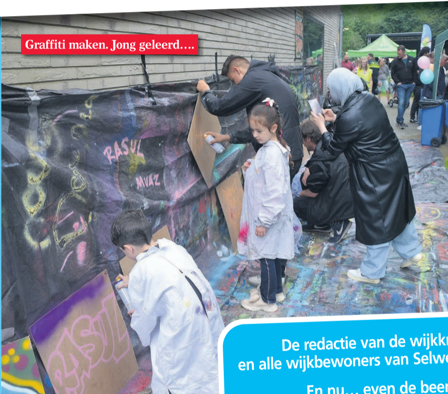
Graffiti maken. Jong geleerd...

Op 25 mei was het zover! Het 60 jarig jubileumfeest werd gevierd. Het was erg gezellig. Het programma was zeer gevarieerd en het publiek enthousiast. We konden nog net wat foto's meepikken in deze krant, zodat degenen die er waren nog even na kunnen genieten. En wie er niet was: geniet nog even mee! Fotografie: Hans Mulder. (Tenzij anders vermeld).