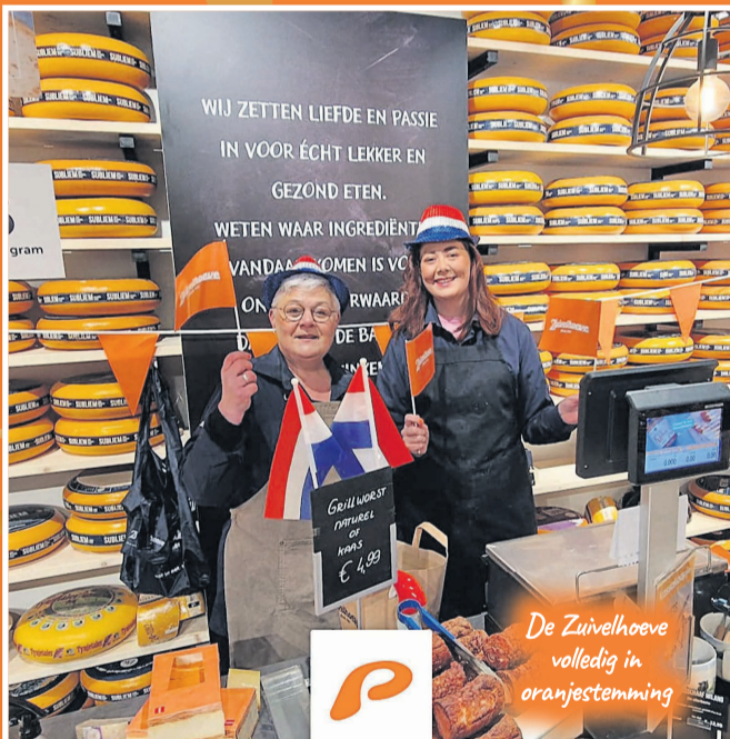
De Zuivelhoeve volledig in oranjestemming