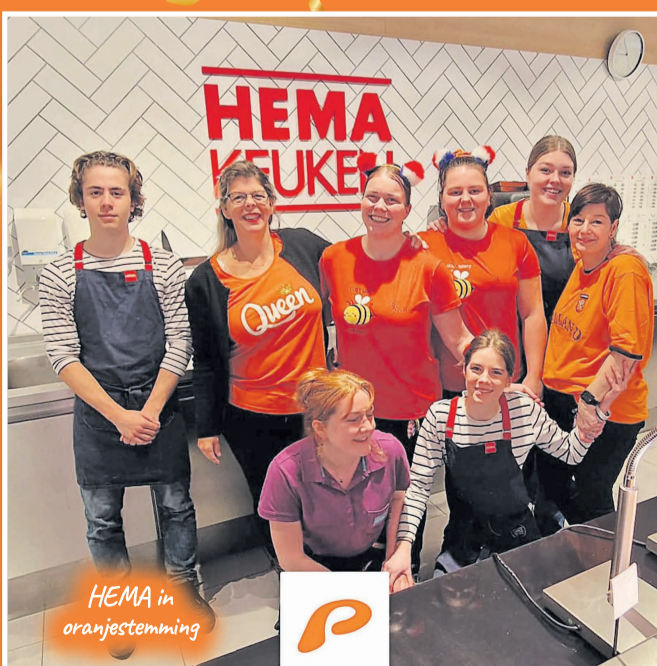
HEMA in oranjestemming