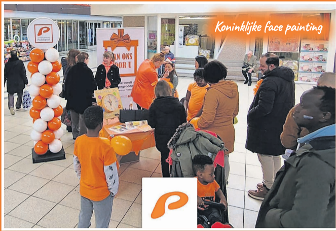
Koninklijke face painting