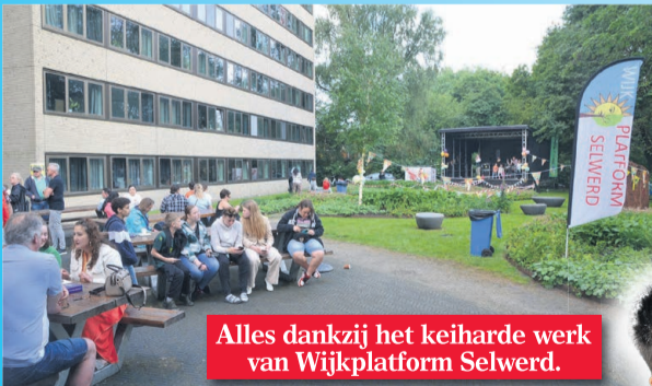
Alles dankzij het keiharde werk van Wijkplatform Selwerd.