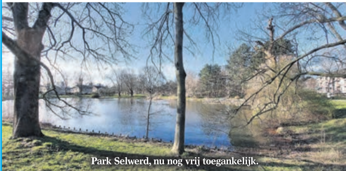
Park Selwerd, nu nog vrij toegankelijk.