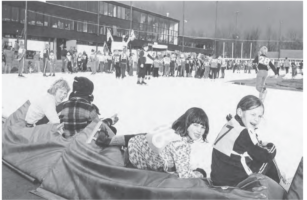
Schaatswedstrijden op kunstijsbaan voor scholen op 8 februari 1974.