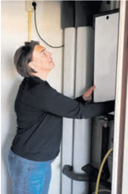
Het warmtenet komt eraan. In Selwerd zijn de eerste koophuizen al op het warmtenet aangesloten. De komende

jaren zullen koophuizen in andere buurten volgen. U heeft als bewoner al veel informatie gekregen over het warmtenet, maar we merken als Wijkraad en Paddepoel Energiek dat er ook nog veel vragen bij u leven. Logisch. Het gaat hier om een belangrijke verandering in uw warmtevoorziening en daar denkt u niet licht over. We merken dat bewoners vooral praktische vragen hebben. Hoe ziet het aanbod van warmtenet eruit? Moet ik m'n huis meteen aansluiten of kan dat later ook? Hoeveel ga ik per maand betalen? Hoe ziet het vastrecht eruit? Hoe komt de warmte mijn huis binnen? Wanneer is mijn buurt aan de beurt? Is het nog slim om een nieuwe CV-ketel te kopen?