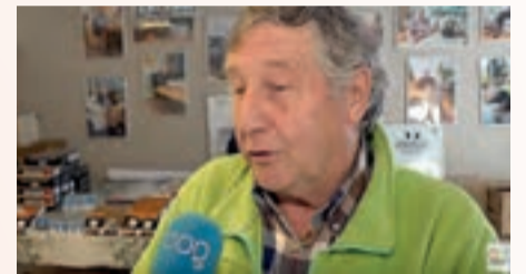
Piet Hazekamp van Paddepoel Energiek staat de verslaggever van OOG TV te woord.

zal zeker hebben bijgedragen. Het Wijkpaleis was sneller dan verwacht door de voorraad heen.