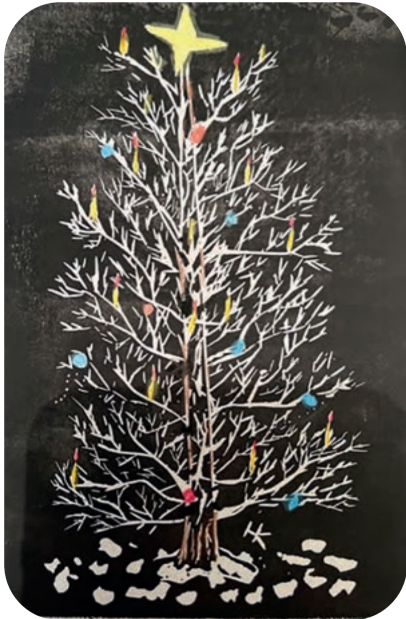
Een lino van een kerstboom

Deze tijd denken wij ook aan onze trouwe vogels in het park: o.a. eenden, meerkoeten en meeu-