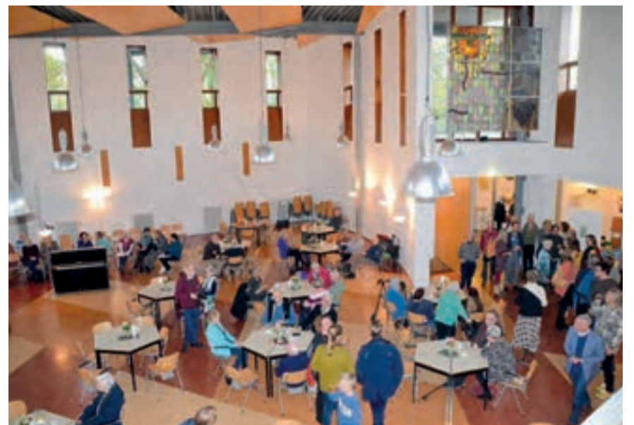
Het openingsfeest op 19 november werd goed bezocht