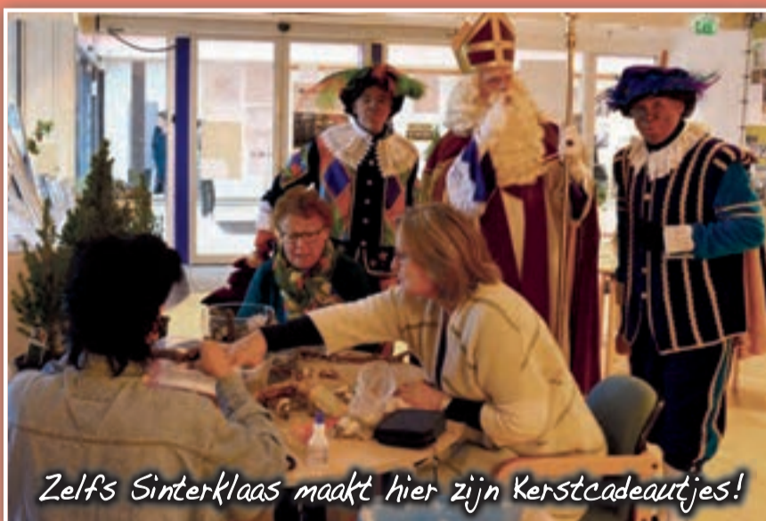
Zelfs Sinterklaas maakt hier zijn Kerstcadeautjes!