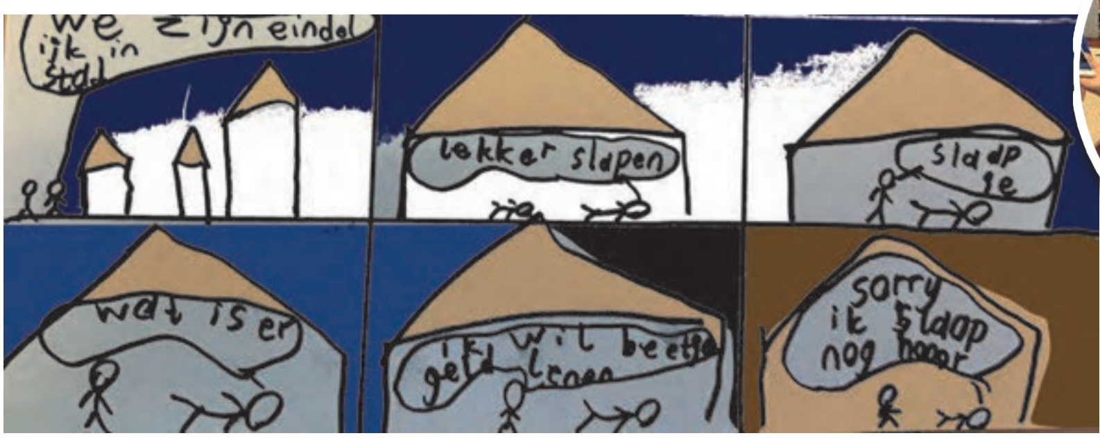
Ridvan vertaalde en tekende deze strip van de klassieke Nasreddin Hoca, de Tijl Uilenspiegel van Turkije