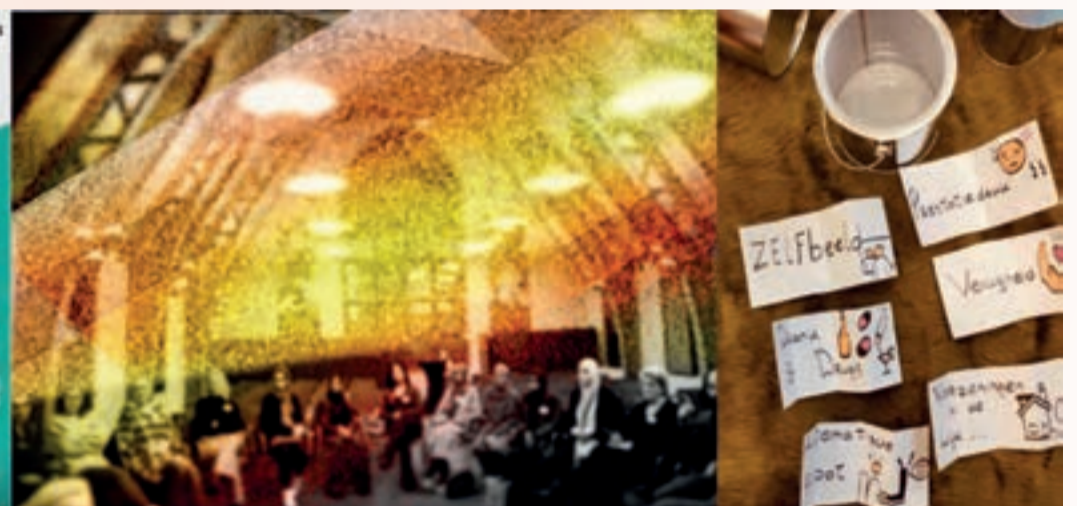
Van links naar rechts: de flyer in de maak. Behalve Hasret waren mede-sponsors: Noorderpoort, Cocreatie Paddepoel, Stichting Islamitische Zorg, Ozan, Piccolo Roma en Pizzeria Sanaa. Midden: foto van het groepsgesprek (foto: Ingrid Werleman/ bewerking: Anders Brinksma). Rechts: de thema's.

ervaringen. Afsluitend werden er open blikken uitgedeeld met wat lekkers voor de sprekers. Dit was een mooi idee. Tijdens de dialoog kwam het gesprek ook op het thema discriminatie en racisme. Jaël, medeorganisator van Open Blik wil de aandacht hier graag nog eens aandacht