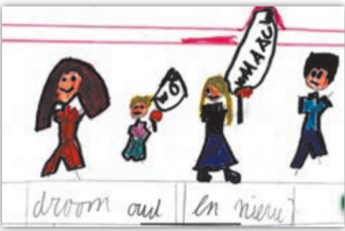
Tekeningen: Lise Kapma

Wilt u zeggen hoe het werkt? Weerwolf is een spel wat je met zijn allen speelt en dan zitten er een paar weerwolven in een dorp en die weerwolven vermoorden 's nachts altijd onschuldige burgers. En dan moet je er met elkaar achter komen