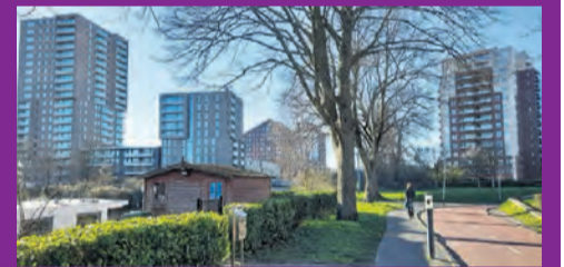
Links Crossroads, rechts Paddepoel

Natuurlijk, landjepik dat mag niet. Deze dagen komen de eerste bewoners in Crossroads, het grote en hoge nieuwe complex van meer dan 150 woningen op nog geen 25 meter van Paddepoel bij de ACM fietsbrug. Op welke wijk gaan die mensen zich richten? Het is eigenlijk Vinkhuizen, de Reitdiepzone, maar de Jumbo Oranjewijk is dichterbij. Dat is natuurlijk maar een beperkt gebeuren vergeleken bij het aanbod van ons winkelcentrum Paddepoel. En daar ben je zo. Zeker op de fiets. Misschien daar ook de Nummer 1 in de brievenbus?