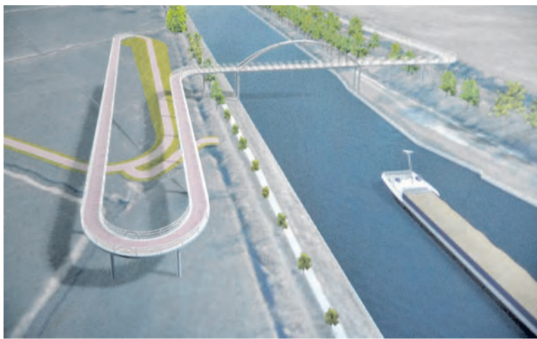
Voorkeursvariant Paddepoelsterbrug.

... Voor alle duidelijkheid: Brugterug verwachtte elke mogelijke uitkomst voor een locatie. ... Wij vinden het zeer kwalijk dat de gemeente de illusie heeft gecreëerd en in stand gehouden dat er een keuze was terwijl dit niet zo is. Hoe we wél verder als Brugterug gaan weten we nog niet, we zullen zien. We blijven hopen dat er ooit een verbinding terug komt die een groene stad en een vervanging van wat vernietigd is waardig is.