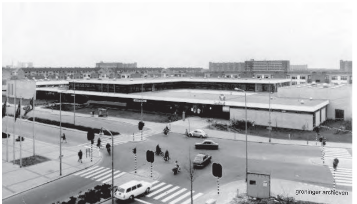
De Trefkoel

Twee dagen later, op woensdag 16 oktober 1968, was er de gelegenheid voor de ouders en ouderen in de wijk om een soortgelijke bijeenkomst bij te wonen ook in De Boerderij. Daar kwam de wens naar voren voor een dagverblijf voor kinderen, waarvan de moe-