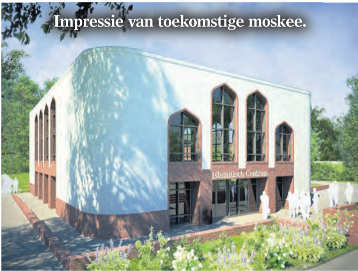
Impressie van toekomstige moskee.

naar de verdiepingen. Anne-mer OZ Bouw bouwt de nieuwe moskee, naar een ontwerp van Studio SKA. Binnenkort zijn ook de vloeren klaar. Dan wordt begonnen met de opbouw van de gevels.