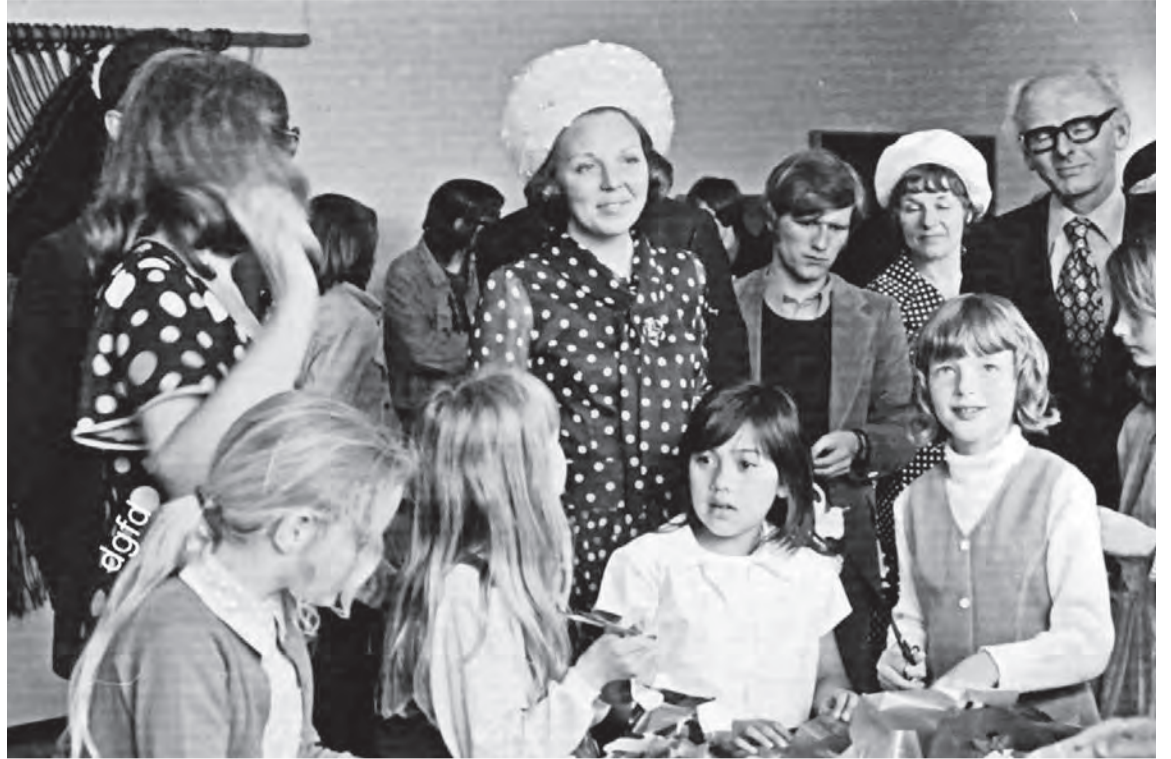
Prinses Beatrix bij opening De Trefkoel in februari 1972

De jongeren van de stadswijken Selwerd en De Paddepoel kregen inderdaad enkele dagen later de mogelijkheid om in De Boerderij in Selwerd (die destijds werd gerund door de Groninger Jeugdraad) een hearing te bezoeken over het te bouwen wijkcentrum. De opkomst was teleurstellend want er waren nog geen 20 jongeren aanwezig. In het Nieuwsblad van het Noorden